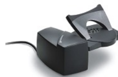
36390-01 Podnośnik słuchawki telefonu