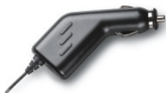
69520-05 Ładowarka samochodowa