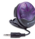
38226-01 Optyczny sygnalizator rozmowy